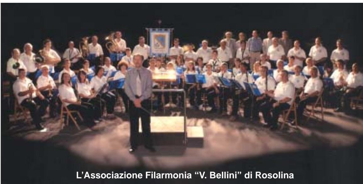
L'Associazione Filarmonia "V. Bellini" di Rosolina