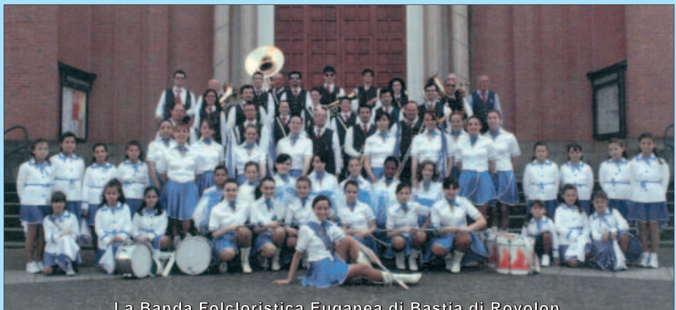
La Banda Folcloristica Euganea di Bastia di Rovolon