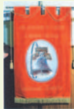
Il Labaro dell'Associazione