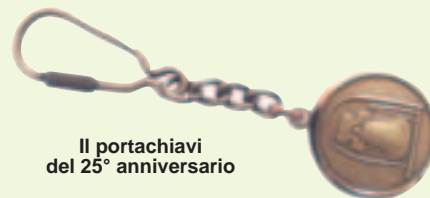
Il portachiavi del 25° anniversario