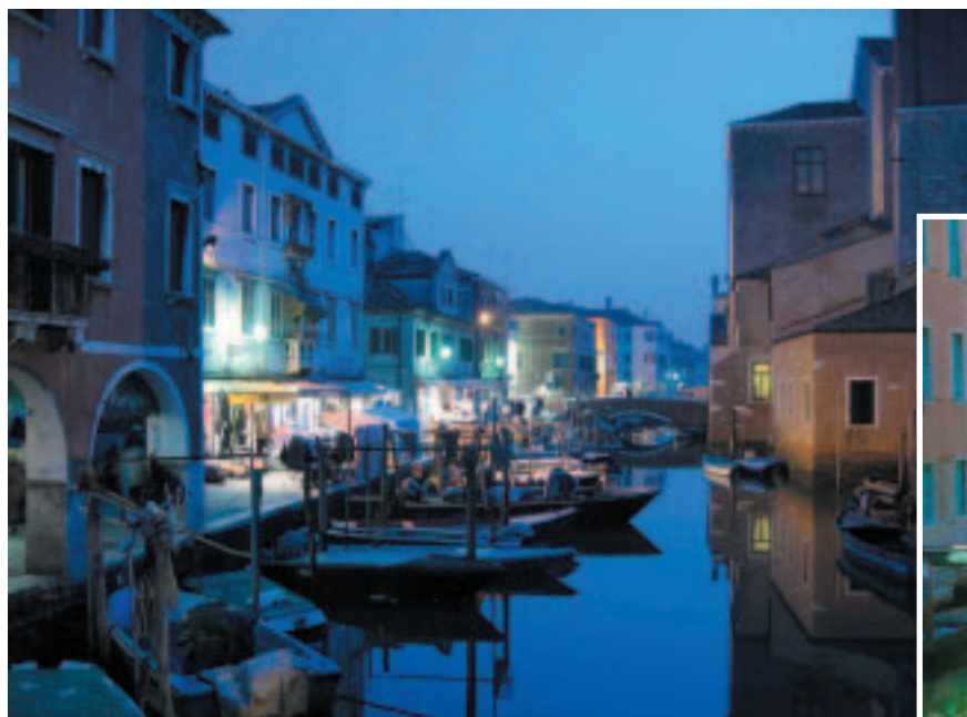
Scorci di Chioggia. Magnifica città diventata Sede Regionale Ambac dall'ultimo Congresso del 12 ottobre 2008.