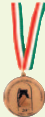
La medaglia del 20° anniversario